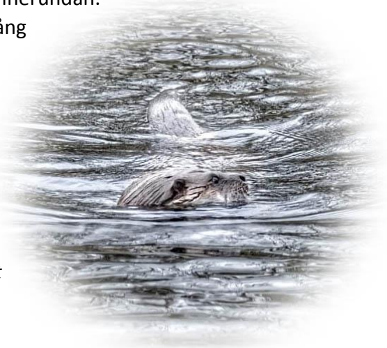
Utter vid Naturum Vattenriket