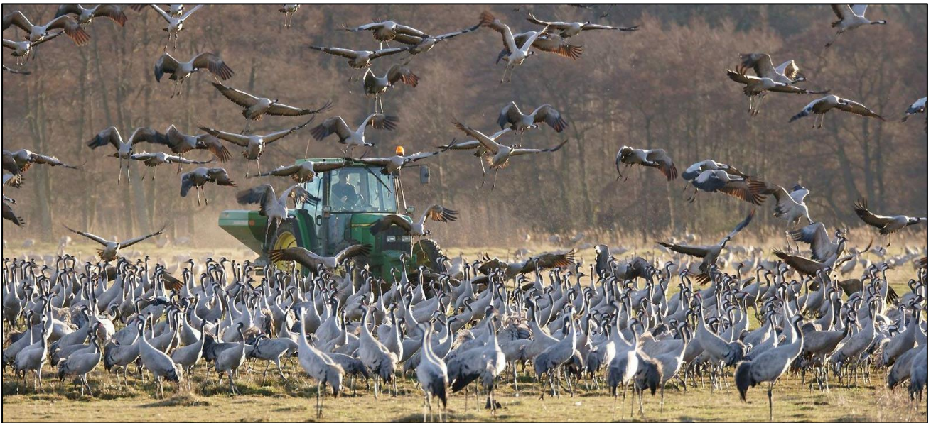
Tranmatning i Pulken 2019, då 10.000 tranor kunde beskådas.

Ett sällsamt skådespel kan upplevas i Pulken, ett par kilometer väster om Yngsjö , då tusentals tranor rastar där runt månadsskiftet mars – april. ÖNF ordnar ingen formell exkursion dit, då det redan finns tranguider och ett korvstånd (!) på plats under högsäsongen. Vi är dock några ÖNF:are som tänkte vara vid Pulken från 16-tiden på söndagseftermiddagen den 29:e mars, vilket torde vara ett bra tillfälle att besöka platsen. Tranorna brukar matas två gånger om dagen under högsäsongen, men det finns inga i förväg bestämda datum eller tider för när matningen kommer att ske. Vi hoppas att få se en eftermiddagsmatning — en traktor som till tranornas glädje kör runt och sprider ut säd över nejden — och sedan det stora infloget av ännu fler tranor i skymningen. (Solen går ner ungefär klockan 19.35 det aktuella datumet.) Vi kanske ses vid Pulken den 29:e mars?