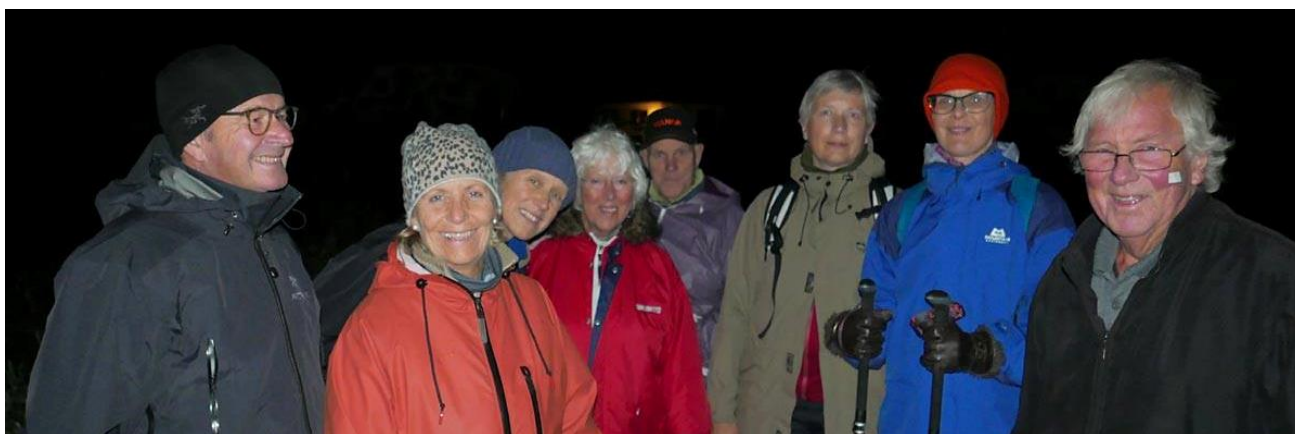
Glada kronhjortsskådare i samma trakt, hösten 2017